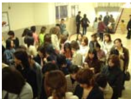
4月に行なわれた大阪イベントの様子。3日で1万人集客