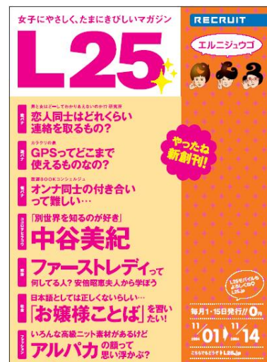
画像は『L25』創刊号表紙