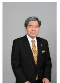
蒲島 郁夫 熊本県知事

引き続き、くまモンは、国内外に向けその魅力を発信し続けてまいりますので、「くまモンタウン」、『くまモンランド化構想』の実現に、どうぞご期待ください。