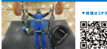
パラパワーリフティング Para Powerlifting