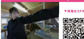
パラ射撃 Shooting Para Sport