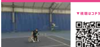
車いすテニス Wheelchair Tennis