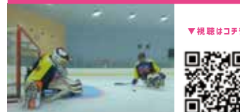
パラアイスホッケー Para Ice hockey