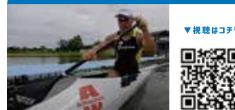
パラカヌー Para Canoe