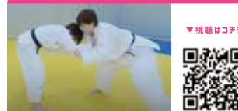
パラ柔道 Para Judo