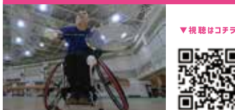
パラバドミントン Para Badminton