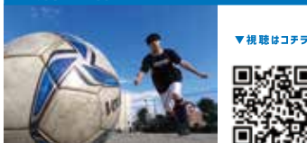
知的障がい者サッカー Football