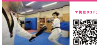
パラテコンドー Para Taekwondo