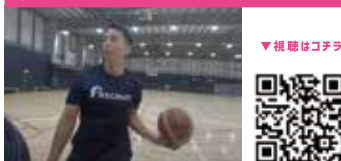
車いすバスケットボール Wheelchair Basketball