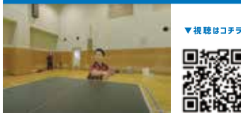
パラ卓球 Para Table Tennis